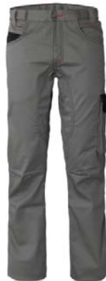
GY – GRIS/NEGRO