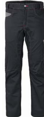
ZY – NEGRO/GRIS