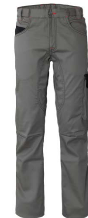
GY – GREY/BLACK