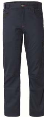
ZX – AZUL/NEGRO