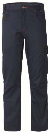
ZX – BLU/NERO