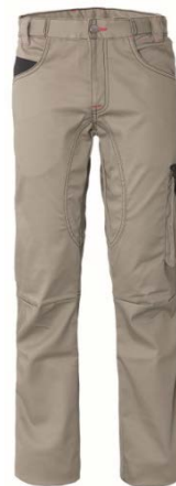
XA – BEIGE/BLACK