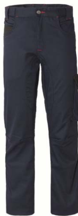
ZX – BLEUMARI N/NEGRU