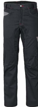
ZY – NERO/GRIGIO