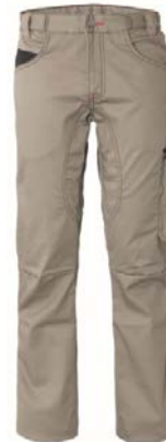
XA – BEIS/NEGRO