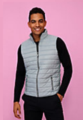
SOL'S WAVE MEN 01436