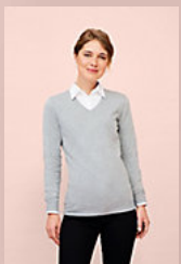
SOL'S GLORY WOMEN 01711