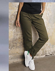
NEOBLU GUSTAVE WOMEN 03179