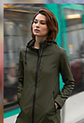
NEOBLU ANTOINE WOMEN 03175