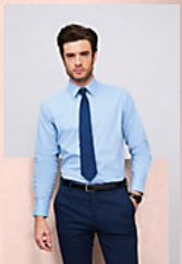
SOL'S BRIGHTON 17000