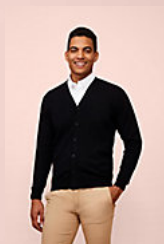
SOL'S GOLDEN MEN 90011