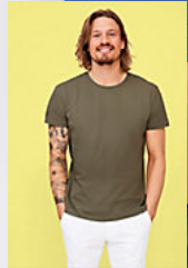
SOL'S MILO MEN 02076