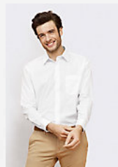
SOL'S BALTIMORE 16040

Taglio sfiancato Colletto rinforzato Stecche rimovibili Tasca lato cuore Patta con 7 bottoni in tinta Polsino regolabile con 2 bottoni Schiena con carré a 2 pinces