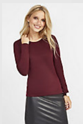
SOL'S MAJESTIC 11425